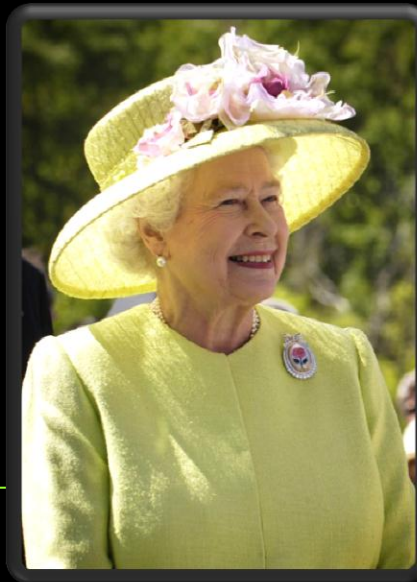
אליזבת מלכת אנגליה

תפקיד המלך ייצוגי, ומצטמצם לחתימה על חוקים, מינוי מועמד לראשות ממשלה.