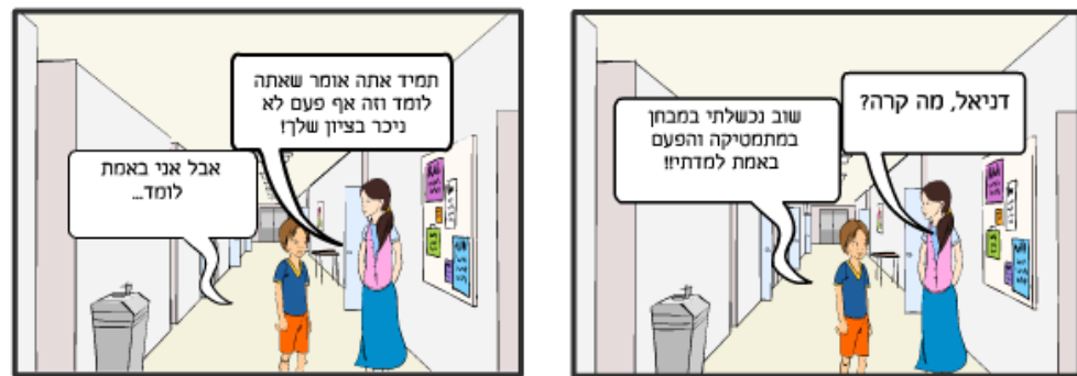
נוצר על ידי צילי לאור ביה"ס התיכון המשותף "חוף הכרמל" מעגן מיכאל