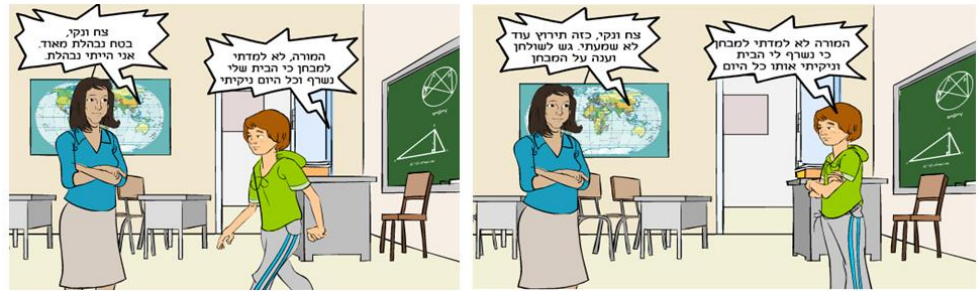
נוצר על ידי נילי אכברט "קריית דרור", בני דרור

דוגמה לתוצרים שנוצרו על ידי הלומדים (הגדל לצפייה):