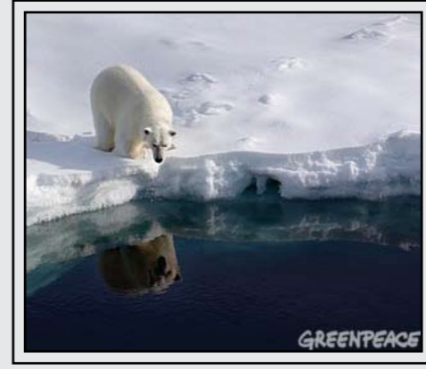
הפשרת קרחונים באזורי הקוטב