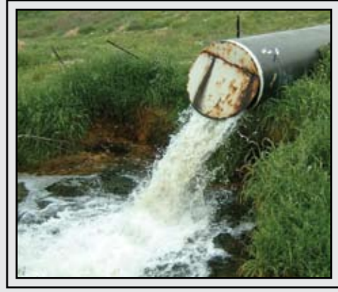
זיהום נחל במי ביוב