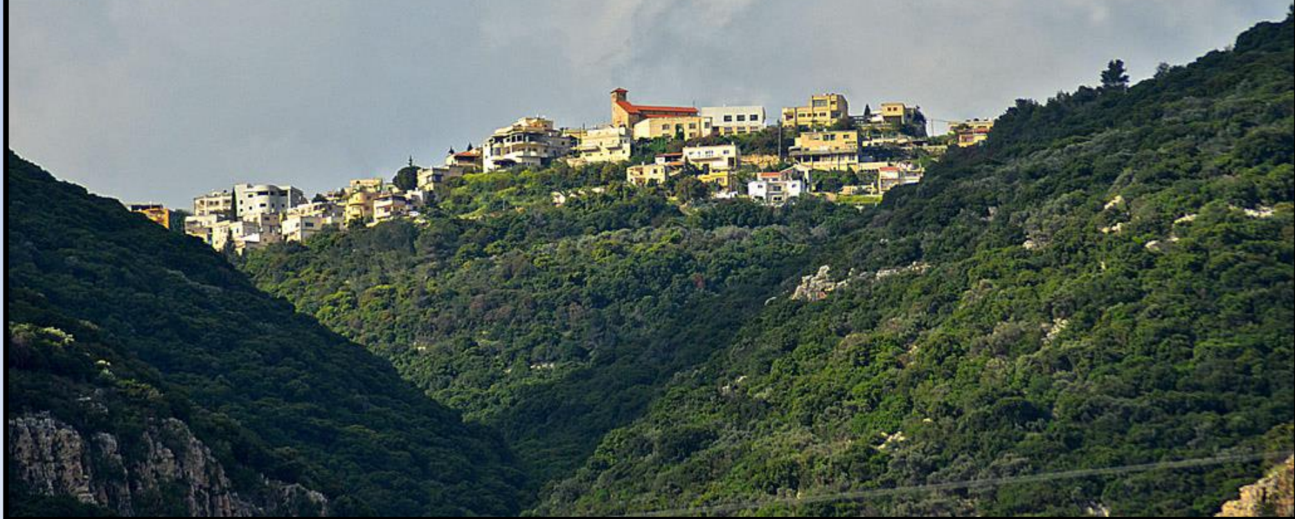
ממראות עוספיה, יישוב דרוזי בכרמל

בעשר השנים האחרונות שני כפרים אלו התרחבו והתפתחו. נבנו בהם בתים ואזורי מסחר רבים, בעיקר לאורך הכביש המחבר ביניהם.