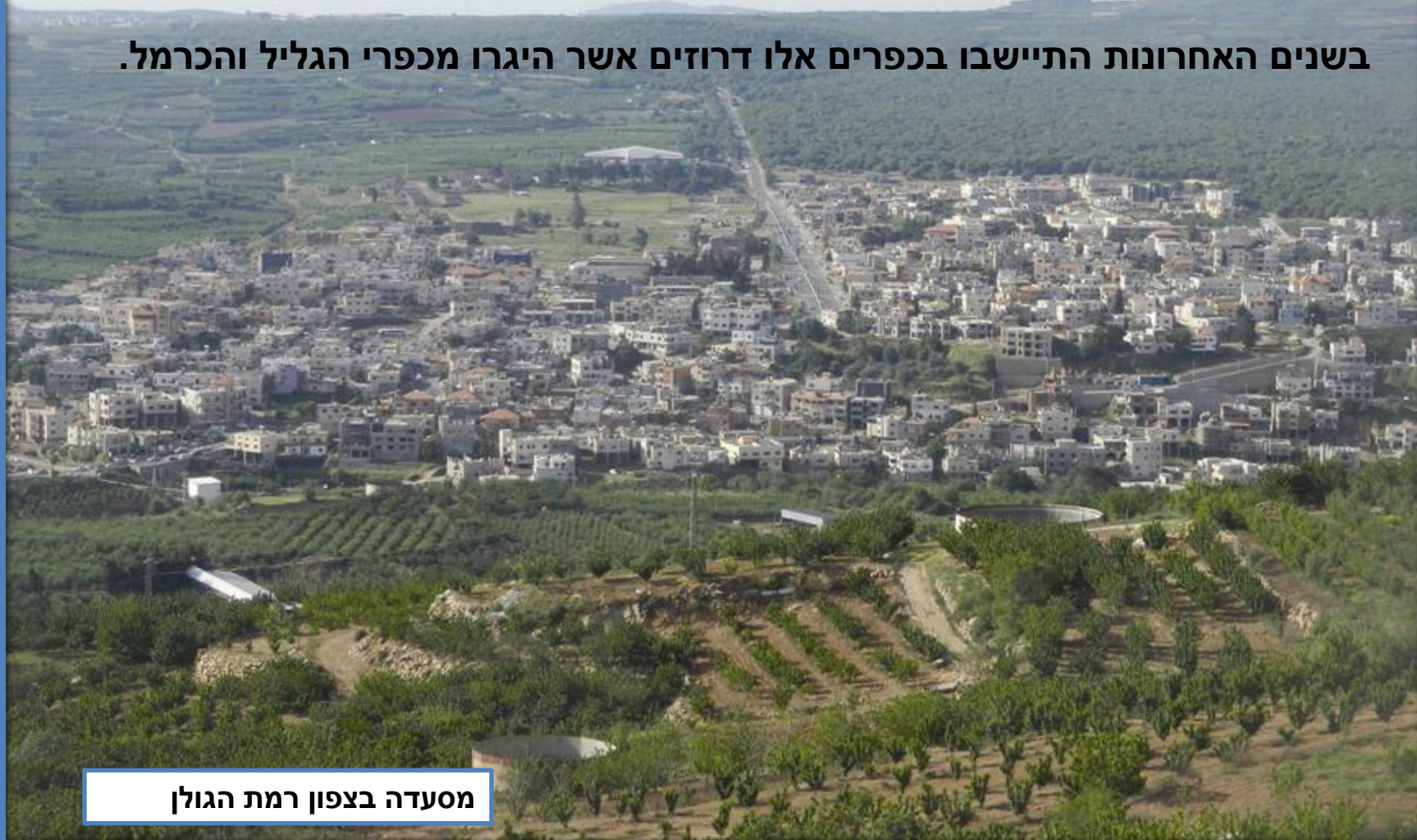
מסעדה בצפון רמת הגולן

בשנים האחרונות התיישבו בכפרים אלו דרוזים אשר היגרו מכפרי הגליל והכרמל.