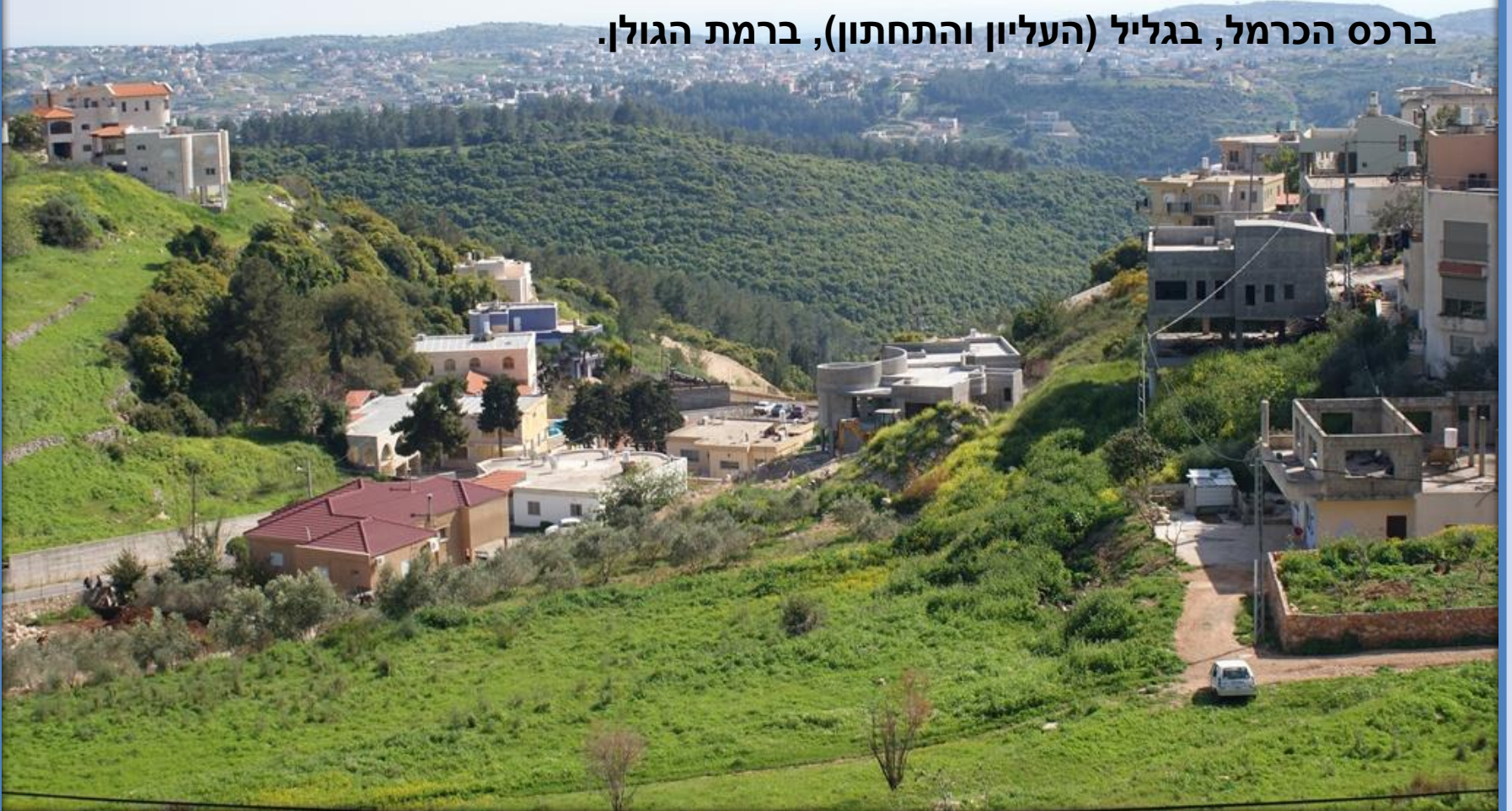
ממראות עוספיה, יישוב דרוזי בכרמל

ניתן להבחין בשלושה ריכוזים של יישובים דרוזים באזורים הללו: ברכס הכרמל, בגליל (העליון והתחתון), ברמת הגולן.