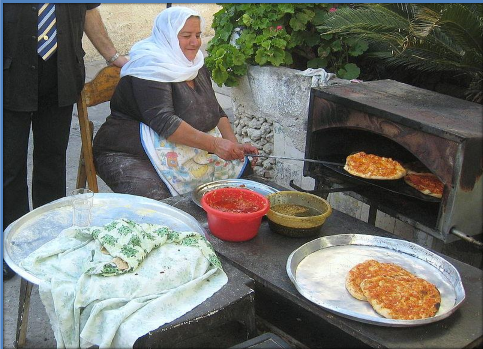
אישה דרוזית מכינה פיתות בעוספיה