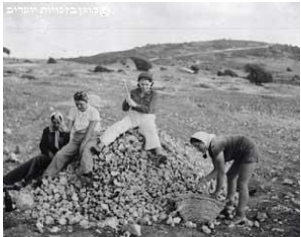
כביש חיפה- נצרת שנסלל בשנת 1925

ניתן למצוא תמונות רבות שממחישות את תנופת סלילת הכבישים ברחבי ישראל.