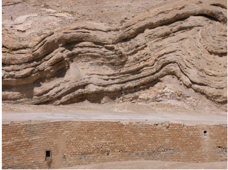
זוהי דרך שנסללה על ידי הבריטים באזור מדבר יהודה.