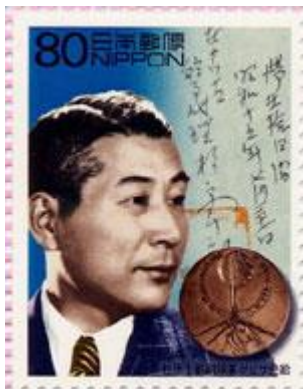
מדליה שהנפיקה ישראל לזכרו