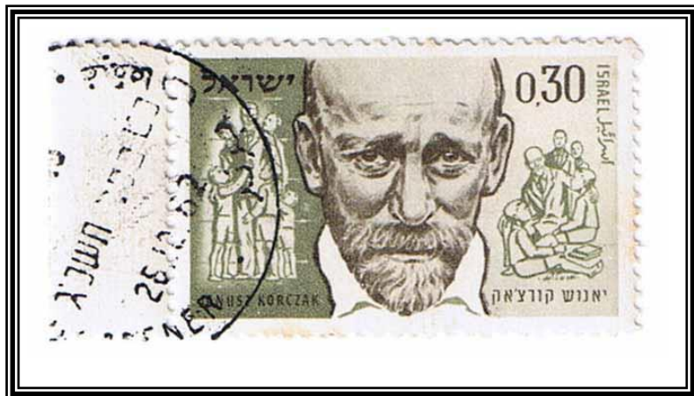
בול דואר בהוצאת מדינת ישראל עם דיוקנו של יאנוש קורצ'אק