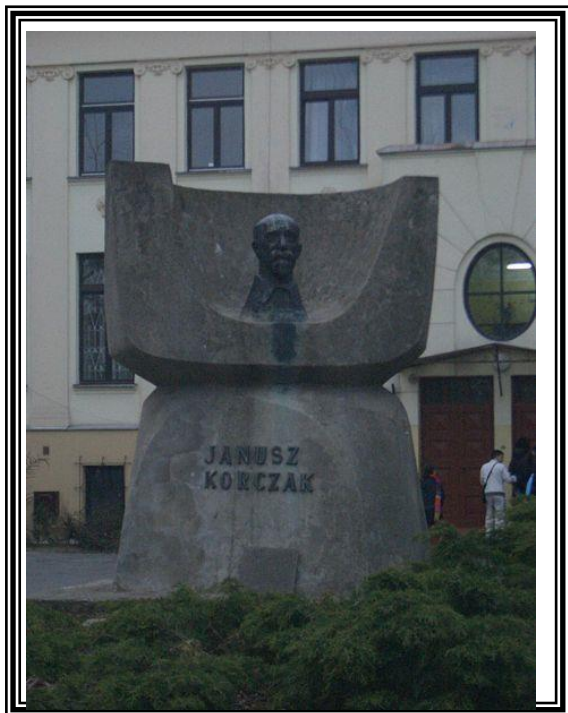
אנדרטה ליאנוש קורצ'אק בפתח בית היתומים בוורשה