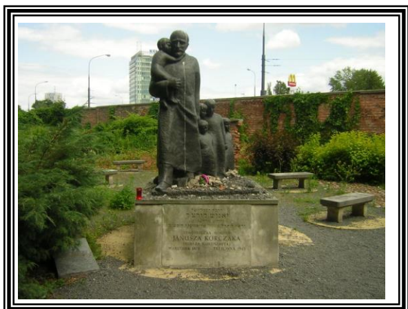
אנדרטה ליאנוש קורצ'אק בבית העלמין היהודי בוורשה