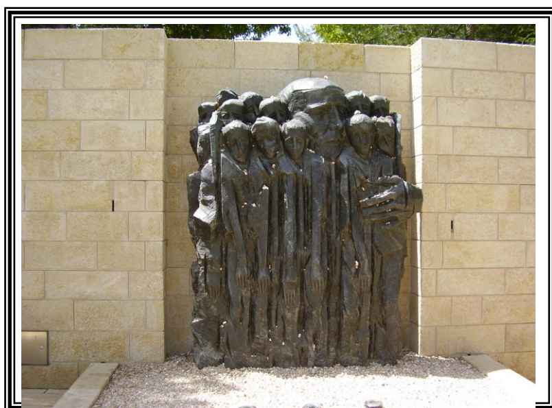
אנדרטה ליאנוש קורצ'אק ותלמידיו ביד ושם