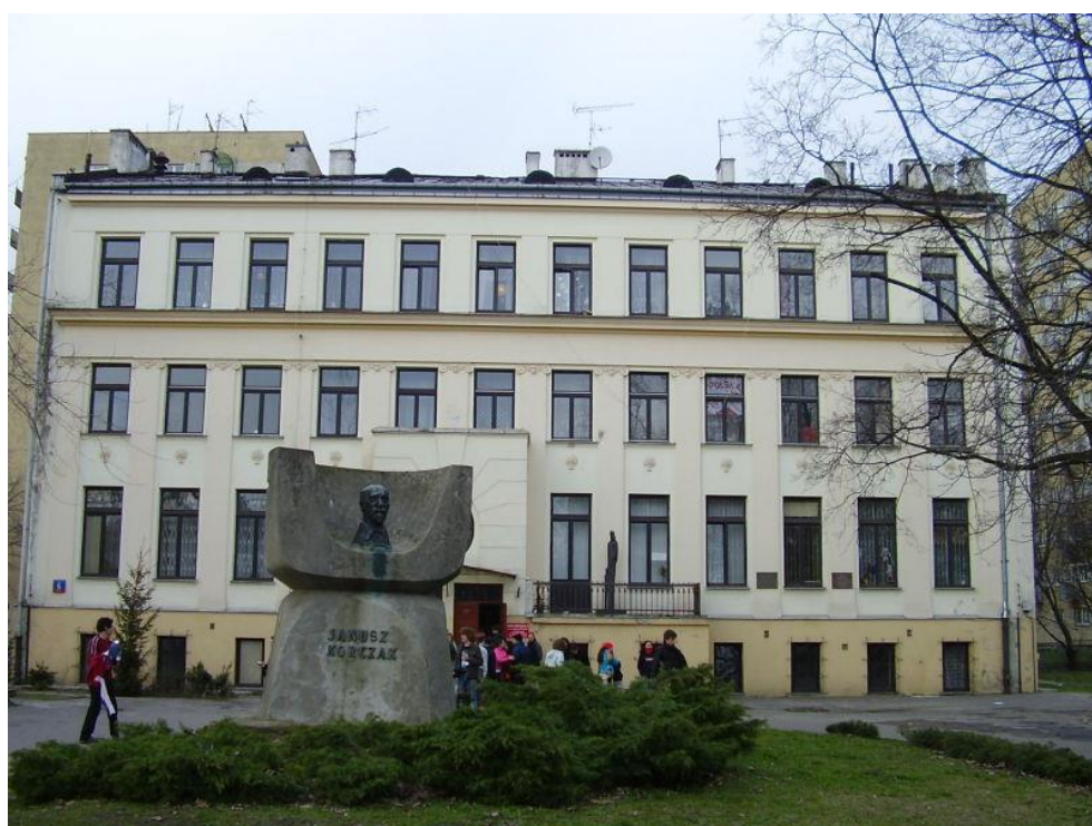
מבנה בית היתומים של קורצ'אק כיום

להישאר עם ילדיו ברגעיהם האחרונים. קורצ'אק העדיף להסתיר מהילדים את המקום אליו מועדות פניהם, ויש אומרים זה השקר היחיד אשר סיפר קורצ'אק לילדיו. הילדים צעדו בטור בגאווה ממבנה בית היתומים האחרון שברחוב שיינה בדרום הגטו הקטן בורשה, אל האומשלגפלץ שבצפון הגטו הגדול, ומשם למחנה המוות טרבלינקה, כאשר קורצ'אק וסטפה וילצ'ינסקה מובילים בראש זקוף ובגאון בעודו מחזיק בדגל בית היתומים הירוק. דגל זה שרד את המחנה, וניתן לראותו בבית קורצ'אק כיום.