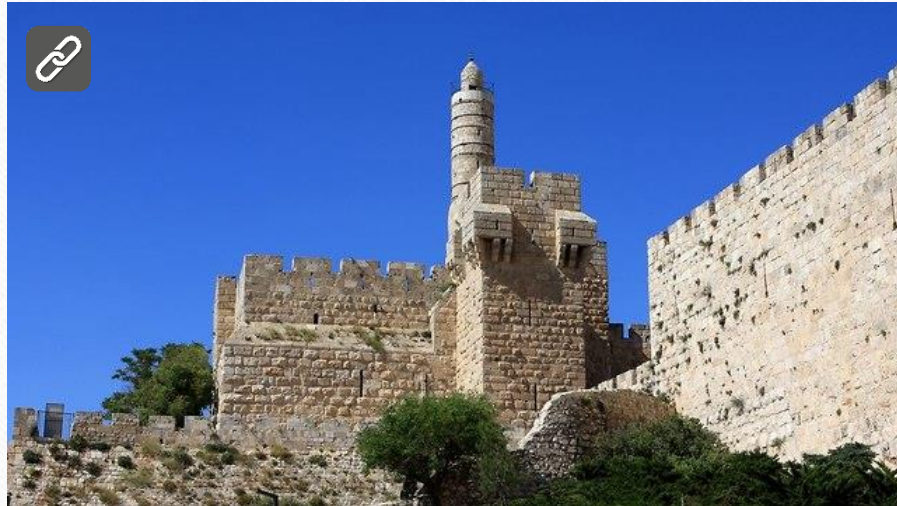
שיעור מספר 2: שמואל ב', פרק ה': המלכת דוד