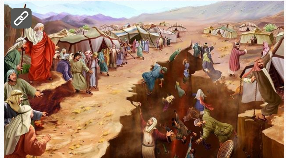
שיעור מספר 1: במדבר, פרק ט"ז: מחלוקת קורח ועדתו