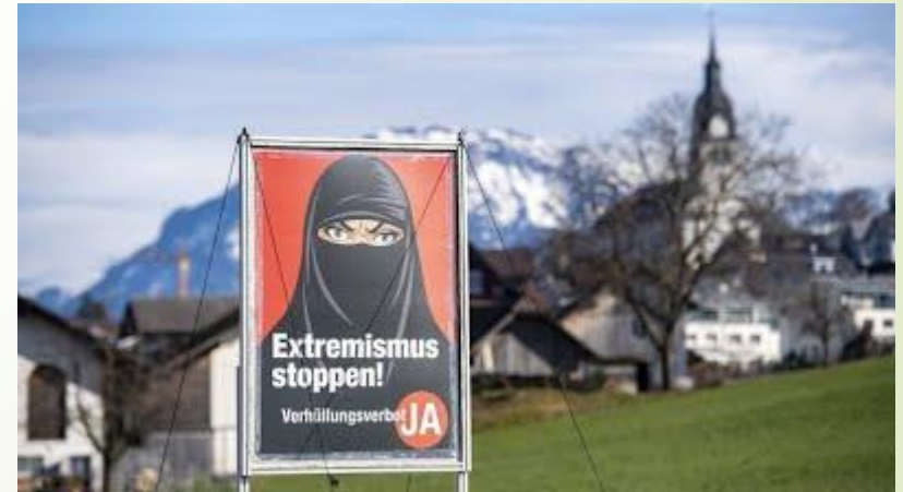
שלט בקמפיין של המפלגה הלאומנית של שווייץ שהובילה את המהלך, מתוך רצון לבלום את האיסלאם הקיצוני, ולאזן דווקא מתוך רצון להגן על כבוד האישה, או על הזכות לחיים ולביטחון של כולם מפני אנשים שישתמשו בכיסוי כדי לבצע פשעים.

האם אתם בעד או נגד כיסוי מלא לפנים, כולל בורקה וניקאב, שהם כיסויים שנשים מוסלמיות עוטות 51.2% הצביעו נגד, ולכן מעכשיו תיאסר עטייה של כיסוי המכסה את הפנים.