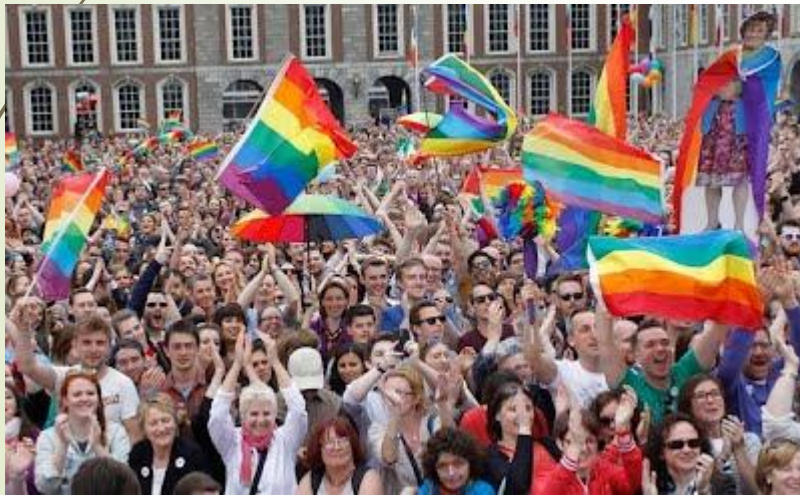
המון אירי חוגג את הניצחון במשאל העם על נישואין חד מיניים.

בשנת 2015 הצביעו יותר מ- 62% בעד קיום נישואים חד מיניים בשנת 2018 הצביעו יותר מ- 66% בעד קיום הפלות בשנת 2019 הצביעו 82% בעד הקלה על חוקי הגירושין.