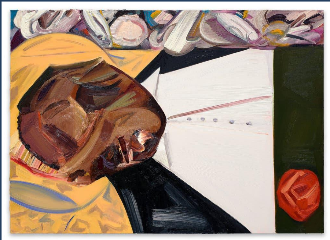
ארון פתוח | דנה שוץ, 2016